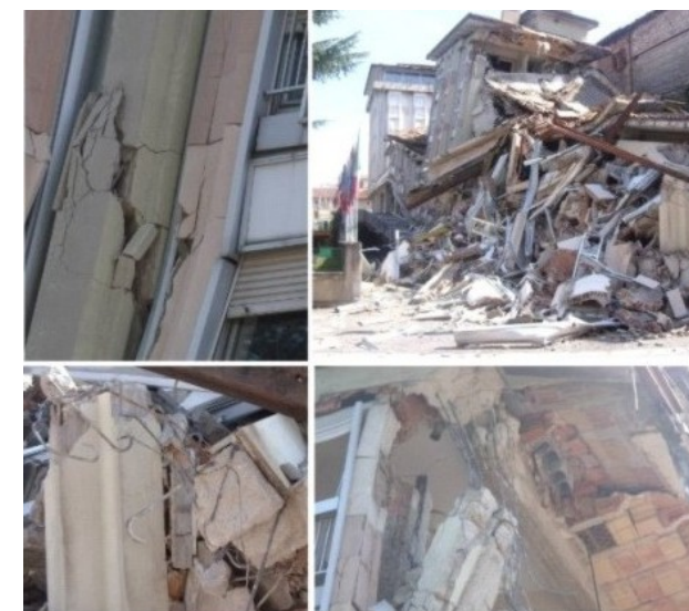
Dopo del Sisma

PEC: segretriageologibasilicata@epap.sicurezza.gov.it