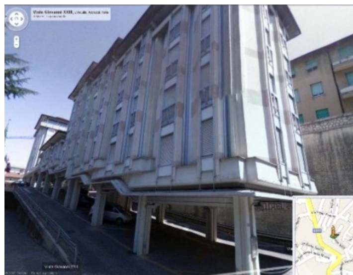
Prima del Sisma